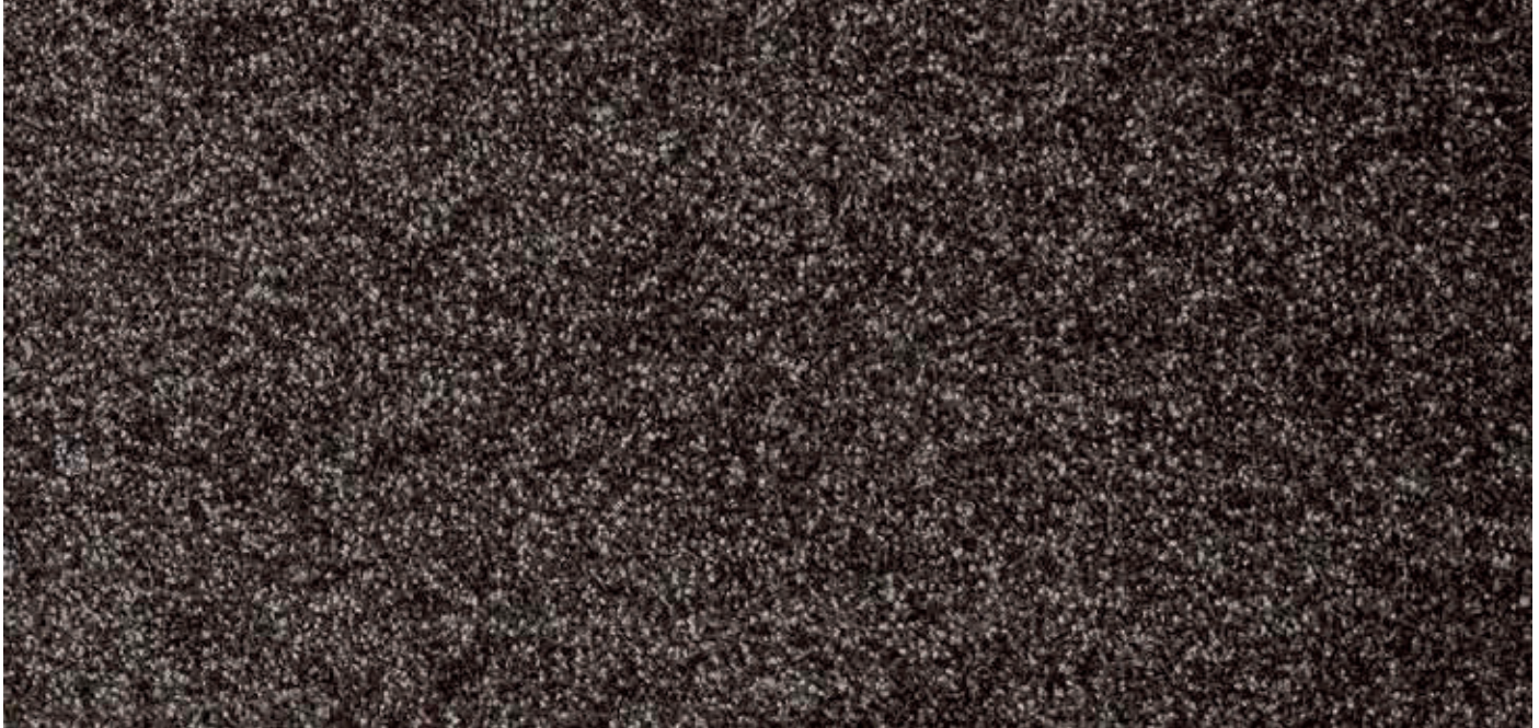
95 4m + 5m